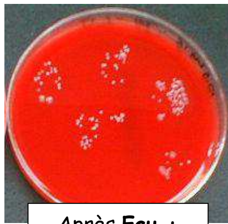
Après Eau + Savon (pendant 30 secondes)