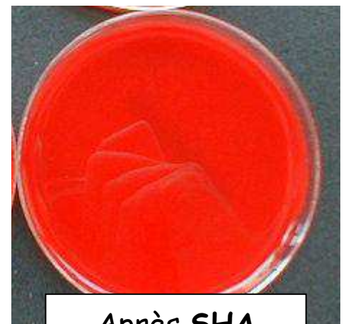
Après SHA (pendant 30 secondes)