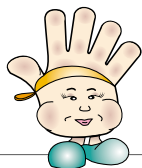
Tableau récapitulatif de l'emploi du KIT